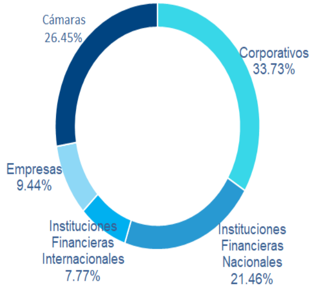
Exposición por Contrapartida (Sept-19)