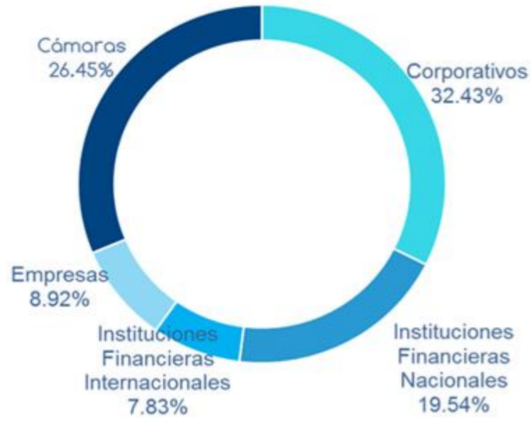
Exposición por Contrapartida (Dic-19)