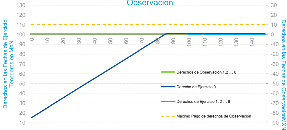
Pago del Total del Título Opcional por Fecha de Ejercicio/ Observación

* Cuando el Derecho de Ejercicio es positivo, el Título se Ejercerá y Liquidará a los tenedores.