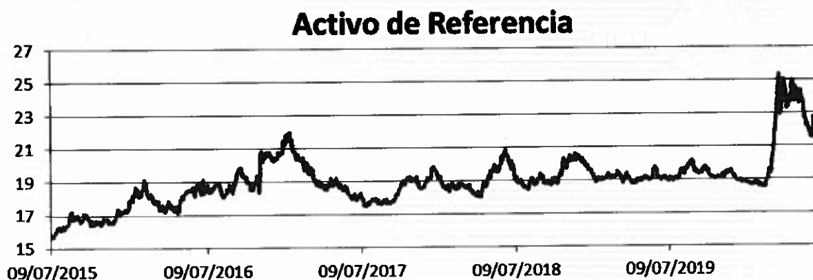
Gráfico representativo por los últimos 6 meses:

Gráfico representativo por los últimos 5 ejercicios: