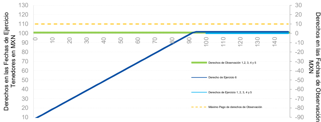
Pago del Total del Título Opcional por Fecha de Ejercicio/ Observación

* Cuando el Derecho de Ejercicio es positivo, el Título se Ejercerá y Liquidará a los tenedores.