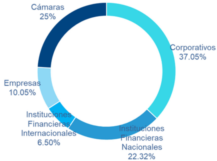
Exposición por Contrapartida (Mzo-21)