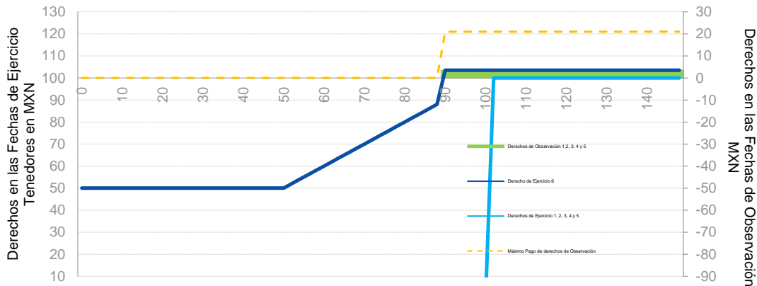
Pago del Total del Título Opcional por Fecha de Ejercicio/ Observación

* Cuando el Derecho de Ejercicio es positivo, el Título se Ejercerá y Liquidará a los tenedores.