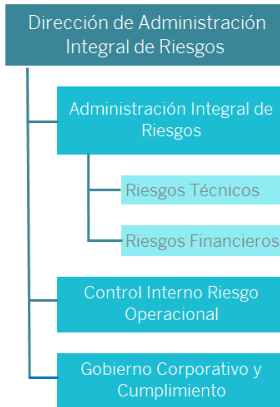
Estructura organizacional del área

Dentro de la estructura ejecutiva del Sistema de Gobierno Corporativo dichas áreas funcionan sistemáticamente con el fin de asegurar el correcto funcionamiento del mismo y evitar posibles conflictos de interés.